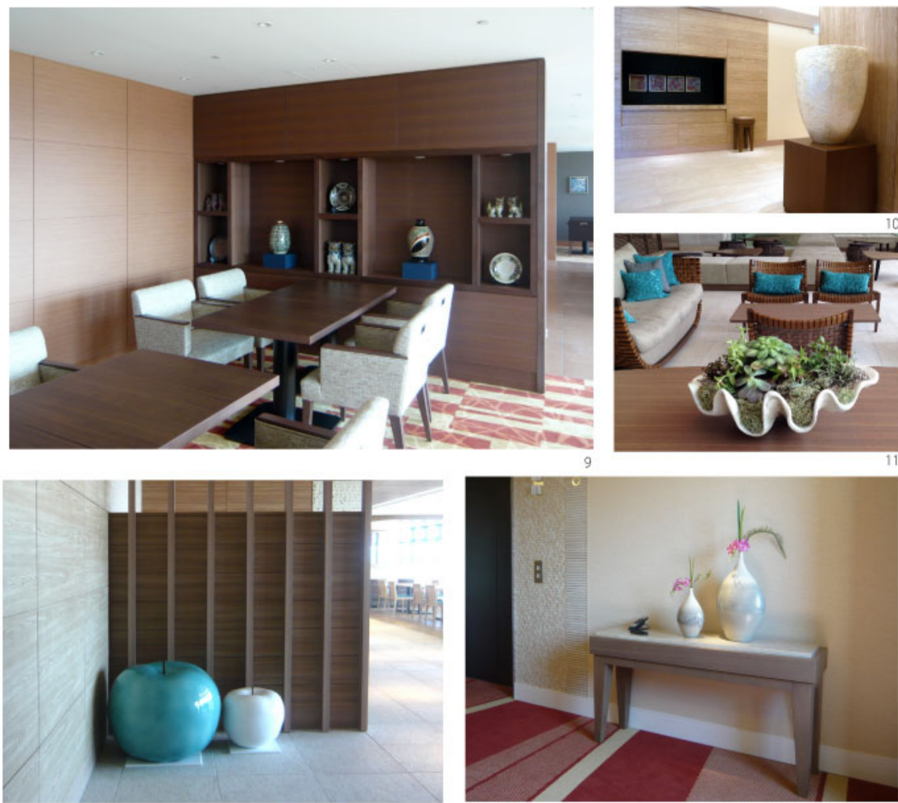
9. 陶器ほか シーサーなど沖縄の工芸作品を集め、棚を装飾。 10. 樹脂、シェル φ710 x 920mm パール素材の花器。海の素材を活かし、リゾート感を演出。 11. セラミック 400 x 250mm オオシャコガイの型を利用した花器に、グリーンをアレンジ。 12. セラミック φ750 x 750mm 大きなフルーツの置物で、リゾート感溢れる楽しさを演出。 13. ガラス 700 x 700mm 珊瑚のモチーフ、透明感ある仕上げで、海をイメージ。