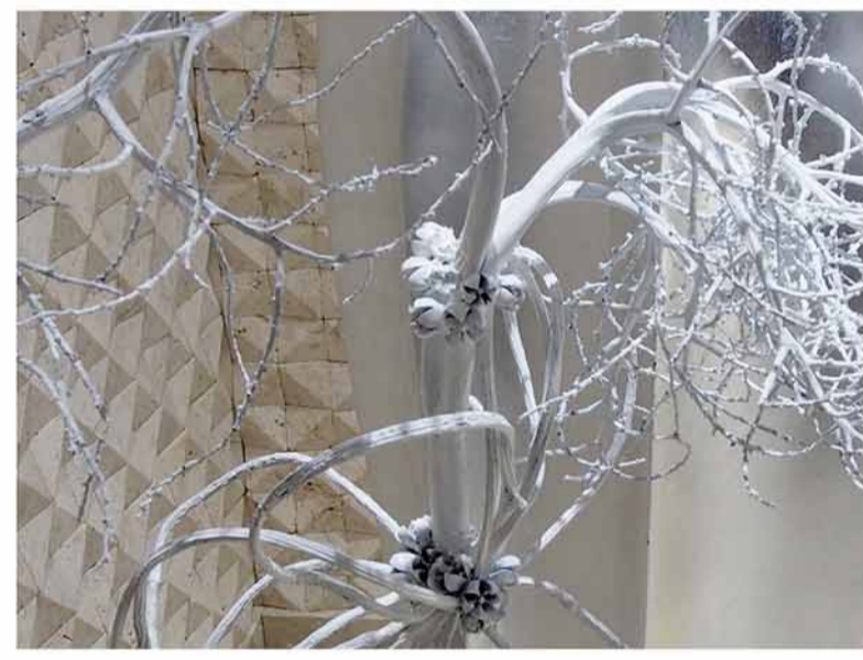
クバの木を成形したアレンジメント細部