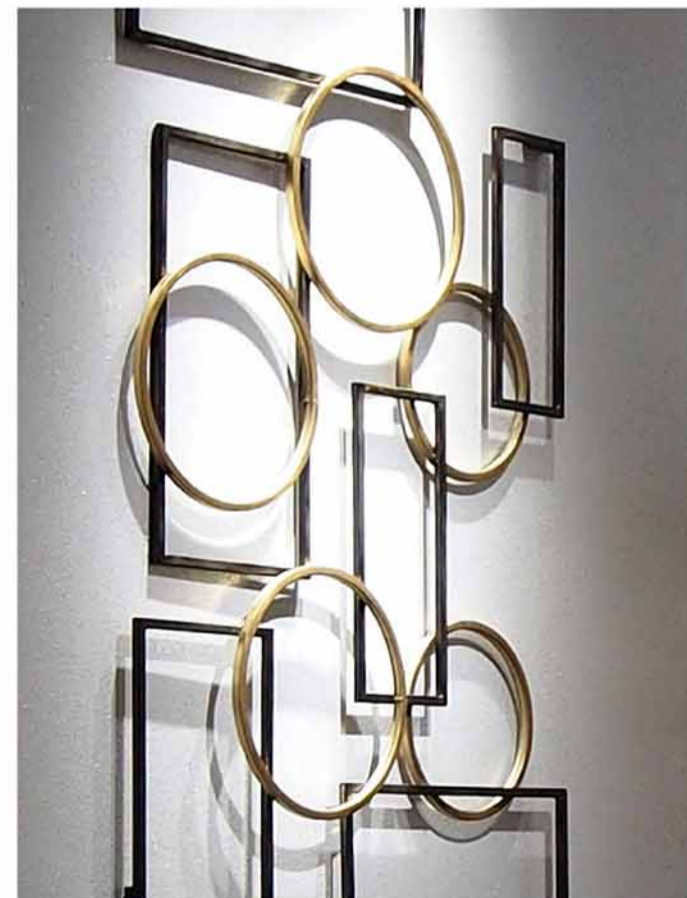
水紋をモチーフとした壁面アート