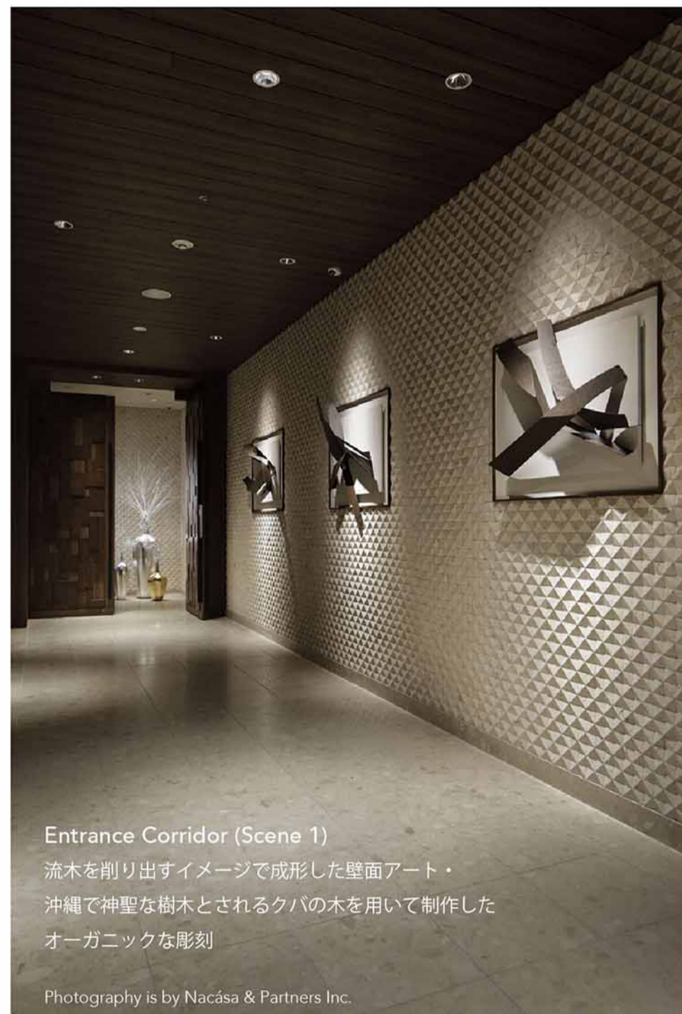
Entrance Corridor (Scene 1) 流木を削り出すイメージで成形した壁面アート・ 沖縄で神聖な樹木とされるクバの木を用いて制作した オーガニックな彫刻

緑に覆われた細い道を歩くとエメラルドグリーンに輝く深い海と、白い砂浜が目の前に広がる。アートシーンがエントランス部分・流木をモチーフとした壁面から始まり、突き当りに Coral fan をイメージしたオーガニックな彫刻、茂みを連想させるガラス彫刻とピクチャレスクに続きます。