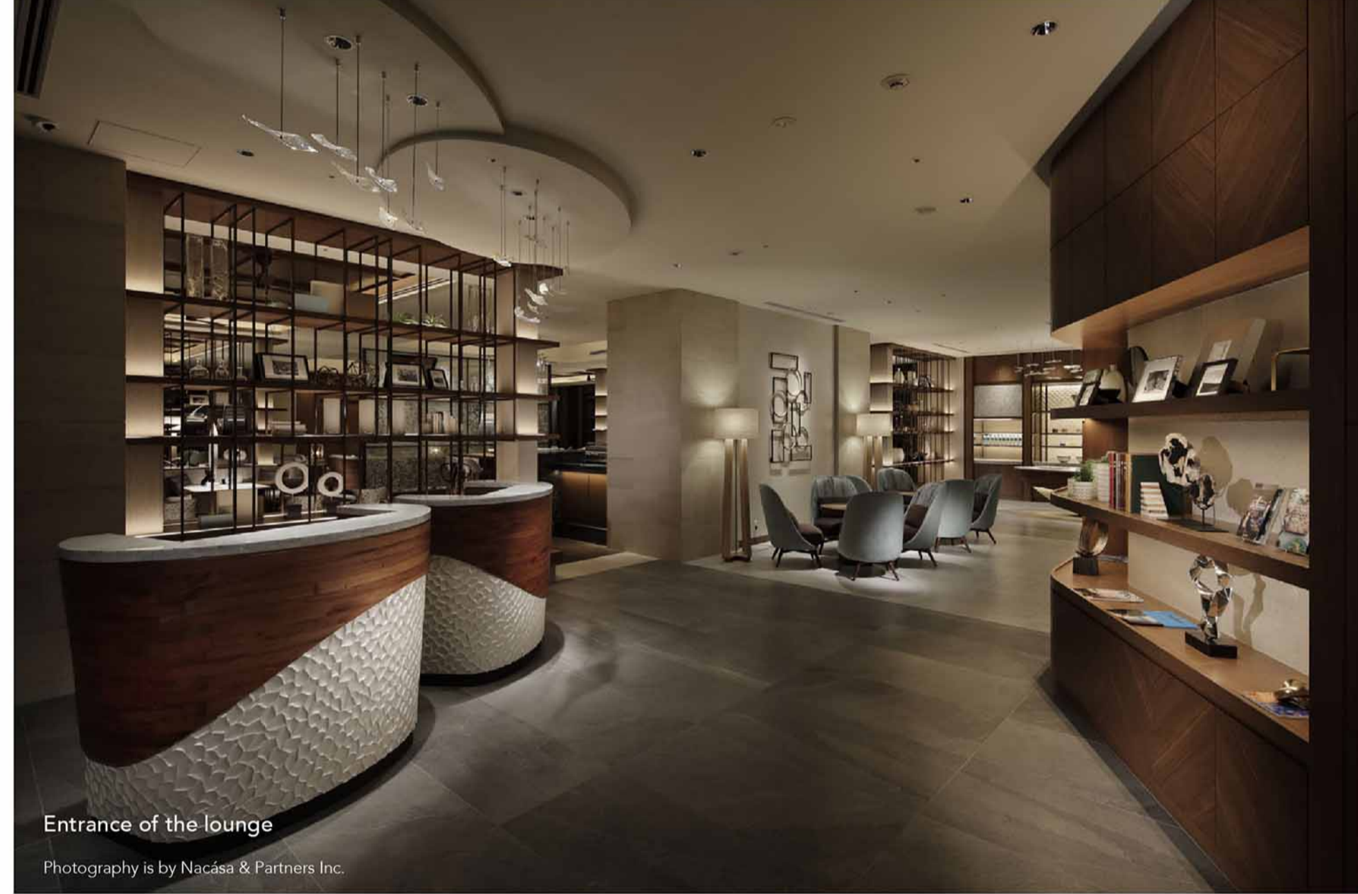
Entrance of the lounge

隠れ家のようにデザインされ、洗練されたラウンジ内部。深いエメラルドグリーン・色鮮やかな珊瑚・透き通るような青い空から抽出した南国の色彩をアクセントに取り入れ、素材と質感を絞り込んだアートがパノラマ写真のように広がります。