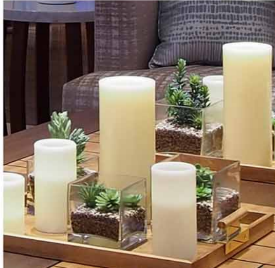
アーティフィシャルフラワー・LEDキャンドル