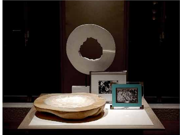
無垢木の彫刻・シェル素材・SUSフレームの組み合わせ