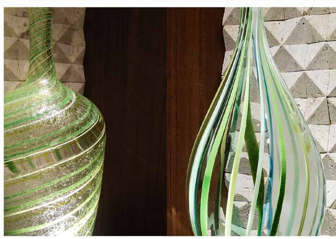
ガラスの異なるテクスチャー・パターンにより、動きのある光を造形します。